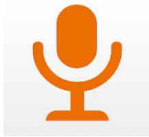
3M Mobile Microphone

1.) Laden Sie nachfolgende App auf Ihrem Smartphone herunter: