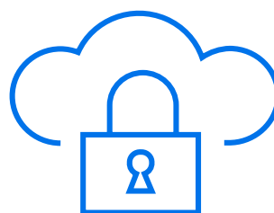
On-Premise oder Hosting-Partner